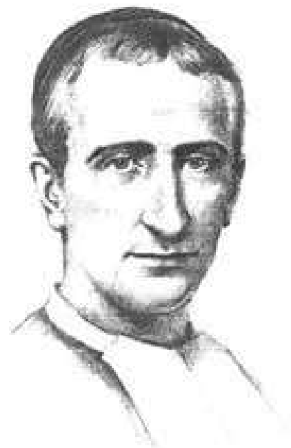
Miguel Febres Cordero.