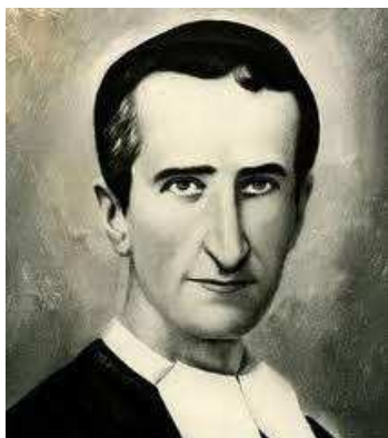
Retrato de Miguel Febres Cordero

El Hermano Cristiano San Miguel Febres Cordero, conocido en la Textología escolar como el autor de la Colección G.M. Bruño, es considerado como uno de los autores de textos de más trascendencia en Hispanoamérica. Este escritor ecuatoriano fue conocido en las aulas escolares por sus textos de Aritmética, Geometría, Álgebra, Lenguaje, español, literatura y religión y otros. Más de cincuenta textos escolares que se estudiaron en todos los países de Hispanoamérica, en España, Francia y en otros lugares del mundo. Por sus méritos religiosos fue beatificado por el Pontífice Paulo VI y llevado a los altares como San Miguel Febres Cordero por el Papa Juan Pablo II.