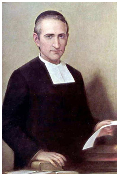
Miguel Febres Cordero.

por méritos de guerra. Influyó notablemente en el Gobierno de Quito en los años de su nacimiento a la vida nacional.