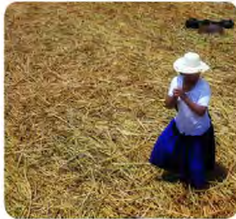
Libro: Ecos en Casos

En el derecho indígena, los instrumentos jurídicos internacionales consagran un derecho a la consulta acerca de las decisiones que son susceptibles de afectarles, asignando un espacio privilegiado a la participación de los pueblos indígenas.